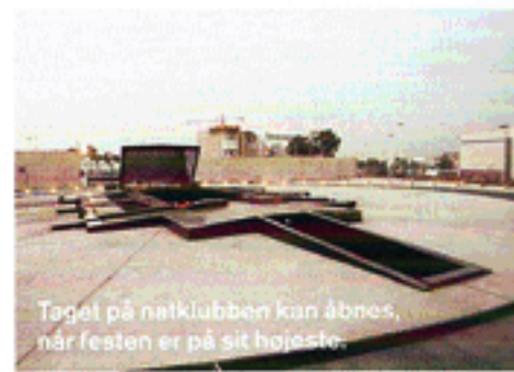
Taget på natklubben kan åbnes, når festen er på sit højeste.

Og derfra skete der ingenting. Trods interesse og store visioner turde ingen binde an med den form for arkitektur. Krigen var overstået, og Beirut skulle genskabes som det 'Mellemøstens Paris', man kendte fra før