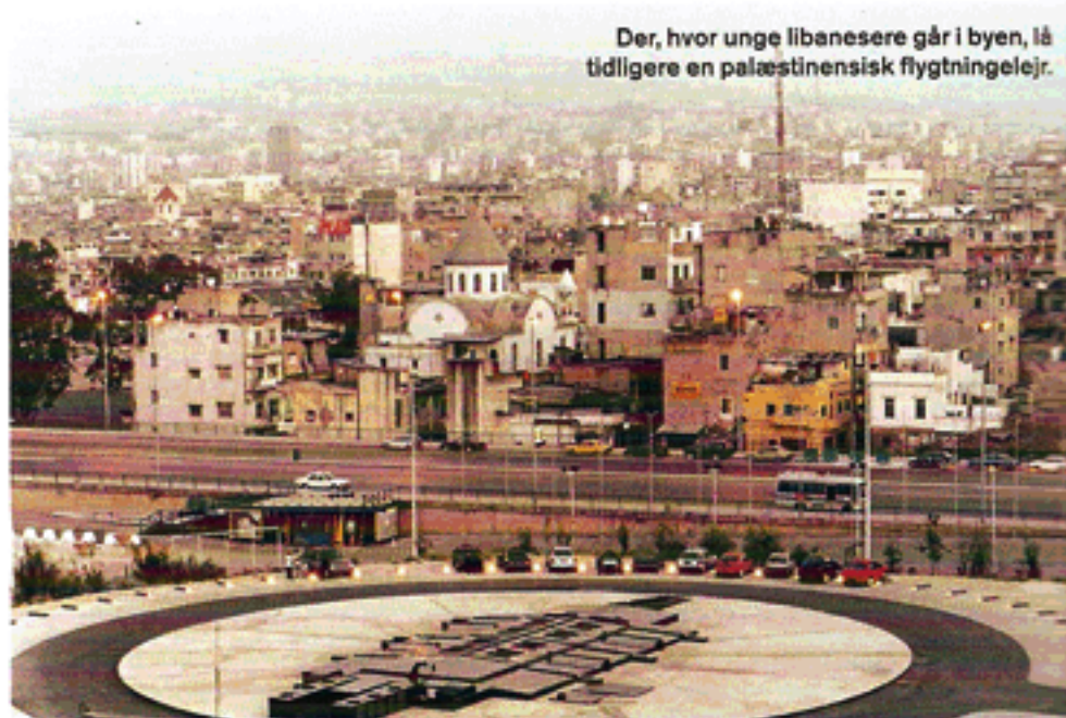
Der, hvor unge libanesere går i byen, lå tidligere en palæstinensisk flygtningelejr.

Natklubben blev en kæmpe succes ligesom dens senere efterfølger, Le Centrale. Den er placeret ved Beiruts gamle krigsmark, den grønne linje, og består af en eksklusiv bar og restaurant i en krigsarret gammel bygning. Huset har bevaret det rå stålskelet rundt om og har en metaltube på toppen, som indeholder baren. Når stål-væggene glider til side, kan gæsterne se ud over den gamle krigsskueplads med genopførte bygninger, gamle ruiner og nye plakater af den seneste myrdede libanesiske politiker i den endeløse cirkel af vold, som Libanon endnu ikke har fundet ud af.