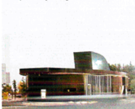
Den bastante BLC-bank i Chtaura tæt på den syriske grænse.

"Jeg kan godt blive lidt træt af at blive fremstillet som den her unge rebelske arkitekt, der danser på gravene om natten. For mig er historien nu. Det handler ikke om massakren på Quarantina i 1975. Det gælder om at fejre de fremskridt, vi trods alt har gjort, og fejre den livsglæde, der findes i Beirut i dag. Klokkeren fem hver eneste nat er Bo-18 fyldt, og det er da noget at