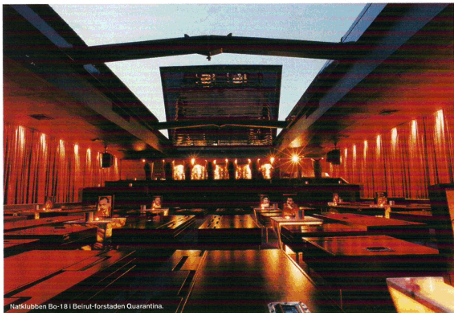
Natklubben Bo-18 i Beirut-forstaden Quarantina.

med sin far (der selv er en af Libanons bedst kendte modernistiske arkitekter) og resten af familien under borgerkrigen. Han studerede arkitektur i USA og vendte efter freden i 1990 tilbage til Libanon med et ambitiøst projekt. 'Evolving Scars', som det hed, gik på at undersøge, hvordan man kan hele arrene efter borgerkrigen og bruge dens erfaringer i arkitekturen.