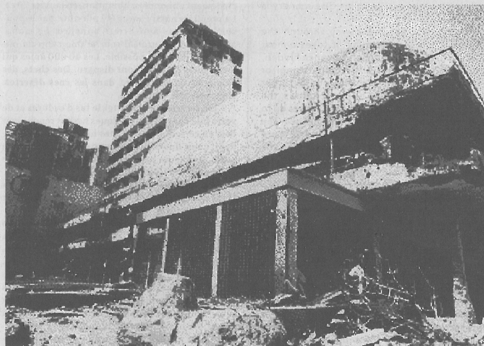
The Egg, Beirut (archive)

was to result in a model architectural project! Sadly, SOLIDERE reinstated an extremely conventional urban plan, with traditional elements of architecture and organization. They only awarded importance to the oldest archaeological layers of the city: the Roman baths, the Byzantine churches, the Ottoman monuments and the buildings dating from the French mandate. They bastardised the dynamics of the city by ignoring the post-1943 period and by jumping blindly into the 1990s. It is not without reason that SOLIDERE's slogan is "a city rooted in the future." This position leads to complete disregard for the