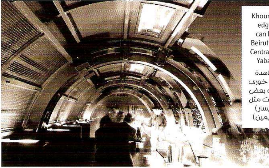
Khoury's cutting-edge designs can be seen at Beirut restaurants Centrale (left) and Yabani (right)

يمكن مشاهدة تصاميم برنار خوري المذهلة في بعض مطاعم بيروت مثل "سنترال" (يسار) و"ياباني" (يمين)